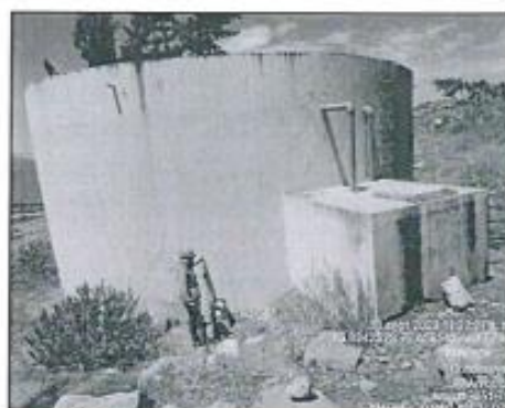
Vistas del reservorio R3.