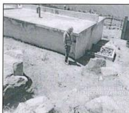
Vistas de reservorios R1 y R2.