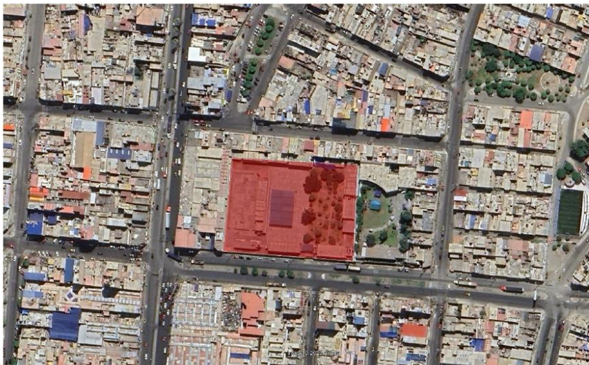
Imagen 01 – Imagen Satelital de la I.E donde se realizará el Proyecto.