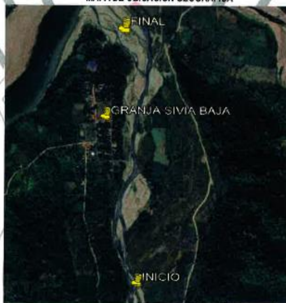
Plano de ubicación Local