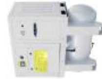
IMAGEN REFERENCIAL COMPRESOR DE 10 HP a 15 HP