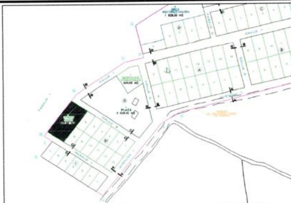
IMAGEN N° 01: ubicación terreno a intervenir, está ubicado en la zona urbana del AA.HH. Las Palmeras del distrito de Vitor ya consolidada que cuenta con todos los servicios básicos.