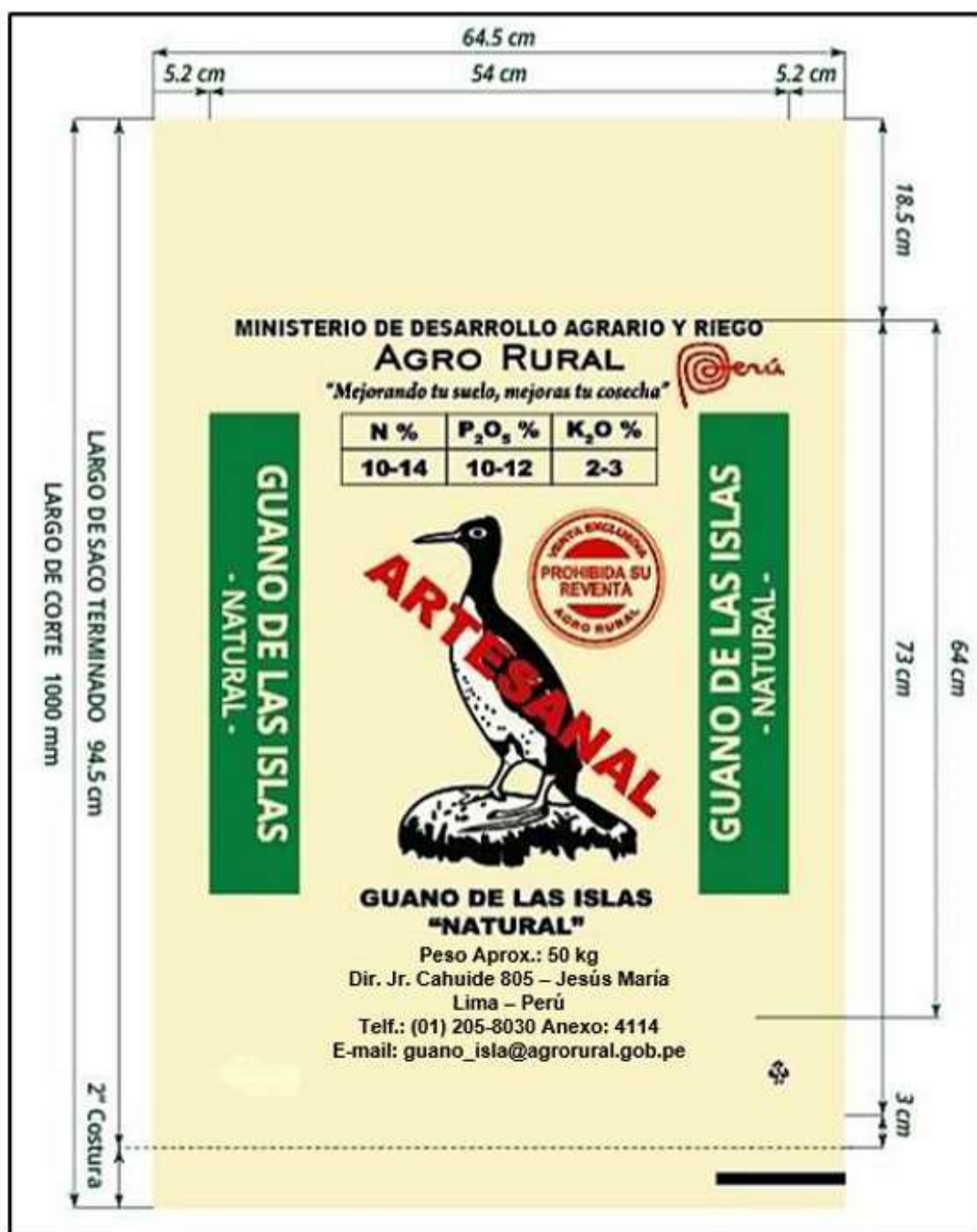
Ilustración 1: Diseño del saco de guano de las islas

"Decenio de la Igualdad de Oportunidades para Mujeres y Hombres" "Año de la recuperación y consolidación de la economía peruana"