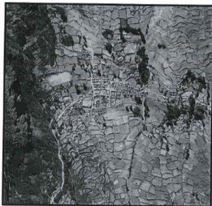
Lugar del proyecto.