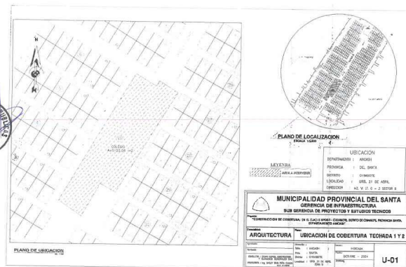
Fig. N°02: Plano de Ubicación del Proyecto.