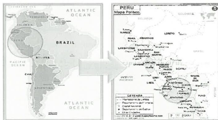
FIGURA N° 01 - MAPA DE UBICACIÓN MACRO

Provincia : Huamanga Distrito : San Juan Bautista Región : Ayacucho