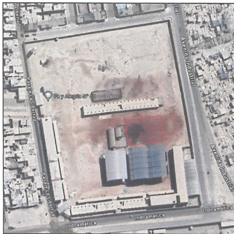
GRAFICO N°02: VISTA SATELITAL DEL AREA A INTERVENIR DE LA LOSA DEPORTIVA Y COBERTURA EN LA I.E. FE Y ALEGRIA 68.

GRAFICO N°02: VISTA SATELITAL DEL AREA A INTERVENIR DE LA LOSA DEPORTIVA Y COBERTURA EN LA I.E. FE Y ALEGRIA 68