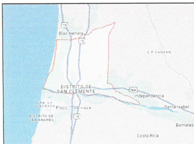
GRAFICO N° 01: UBICACIÓN GEOGRAFICA DE SAN CLEMENTE.

DEPARTAMENTO : Ica PROVINCIA : Pisco DISTRITO : San Clemente