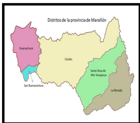
Ilustración N° 01: Ubicación del Proyecto