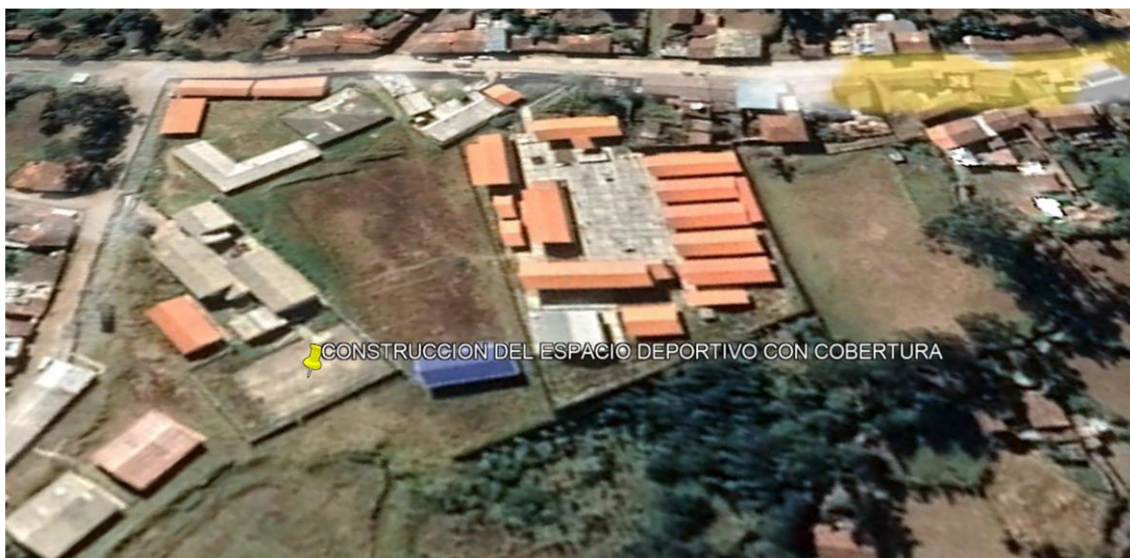
Imagen N° 02: Plano de Localización, País Perú - Departamento de Ancash