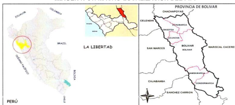
IMAGEN N°01: MACRO-LOCALIZACIÓN DEL PIP.

El distrito de UCUNCHA se encuentran a una altura de 2,603.86 m.s.n.m. respectivamente. Presenta una topografía entre llana y ondulada