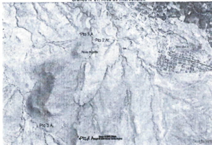
Grafico N°01: Área de intervención

En el análisis de territorio se debe describir y analizar la información sobre las características y las variables referidas al ámbito geográfico en el que se ubica la población afectada y la UNIDAD PRODUCTORA vinculada con la situación negativa, para tal efecto se emplean los siguientes conceptos: