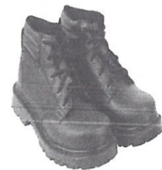
Zapato de seguridad Puntera Acero