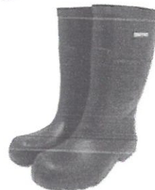
Bota de Jebe

Equipos de Protección Personal (EPPs) los cuales deberán ser reemplazados de acuerdo a la necesidad. En el caso de los cascos de protección estos deben cumplir con los requisitos de absorción de impacto y resistencia a la penetración el personal de mantenimiento deberá usar cascos de color anaranjado, mientras que de los jefes de mantenimiento deberá ser color azul.