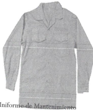
Uniforme de Mantenimiento