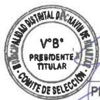
PRESIDENTE TITULAR SR. JUAN CARLOS JESUS SAENZ

Asimismo, se procede la publicación en el SEACE. Culminando con lo actuado se da por concluida la reunión, siendo 5:20 PM, horas del mismo día y año procediendo los miembros a suscribir en señal de conformidad e indicando su respectiva publicación en el sistema electrónico de contrataciones del estado SEACE, firmando el acta los presentes, firmando en el acta los presentes.