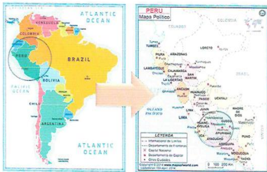
GRAFICO N°02. UBICACIÓN PROVINCIAL Y DISTRITAL.