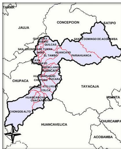
Mapa de Huancayo, ubicando Distritos de Huancayo