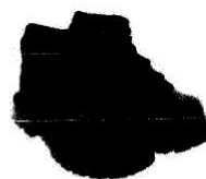
Zapatos de Seguridad con Puntera de Acero