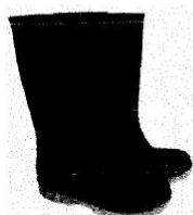
Botas de Jefe