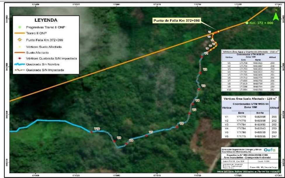
Figura 1. Localización del evento