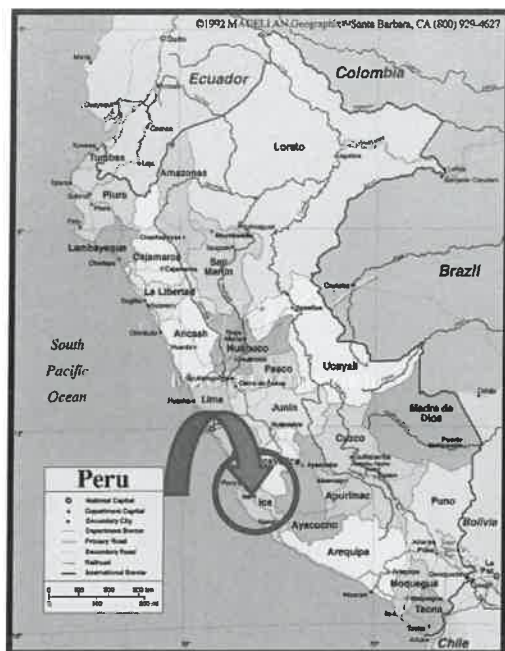
FIGURA N° 1 MACRO-LOCALIZACIÓN