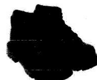
Zapatos de Seguridad con Puntera de Acero