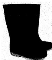
Botas de Jefe