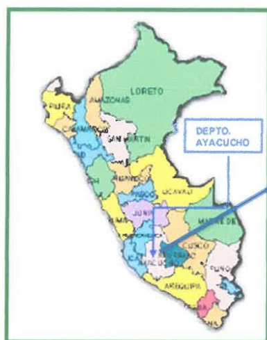
MAPA DEL PERÚ