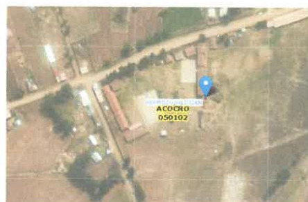
Imagen N° 01: Ubicación nacional, provincial y distrital