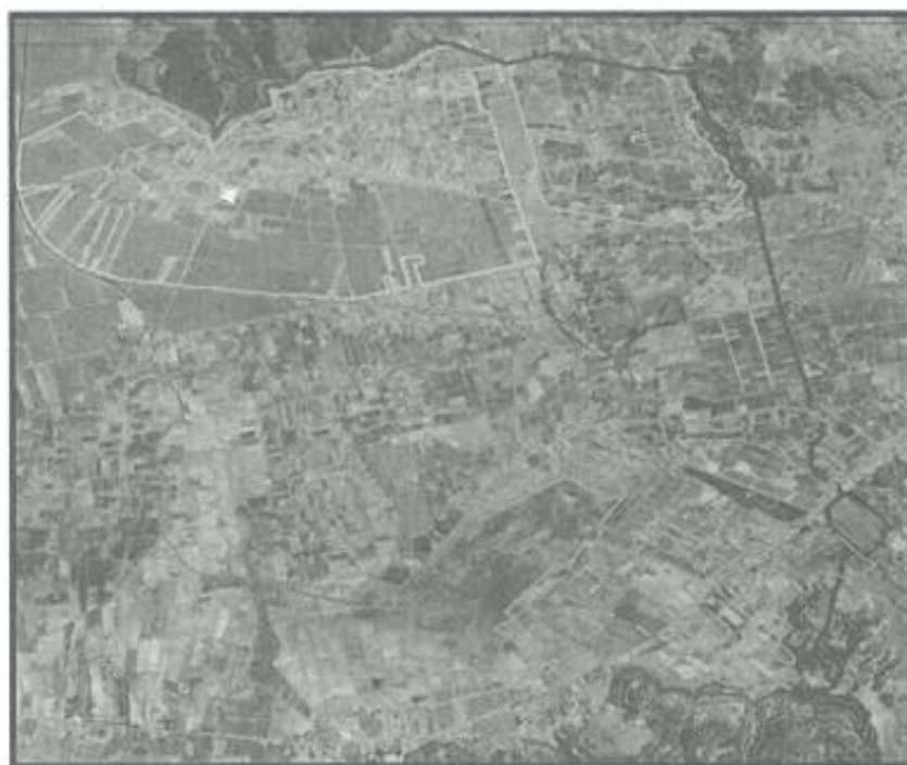
Ilustración 1: Sectores del Sistema de Riego

La propuesta del presente Proyecto consiste en la dotación de agua para riego en los sectores de Yungaqui, Ocoruro, Mosocllacta y Markjo pertenecientes a las comunidades campesinas con los mismos nombres, en el Distrito de Anta, Provincia de Anta, Región Cusco, debidamente reconocidas por los beneficiarios y autoridades locales como la Municipalidad Provincial de Anta. Se irrigará un total de 625.00 ha.