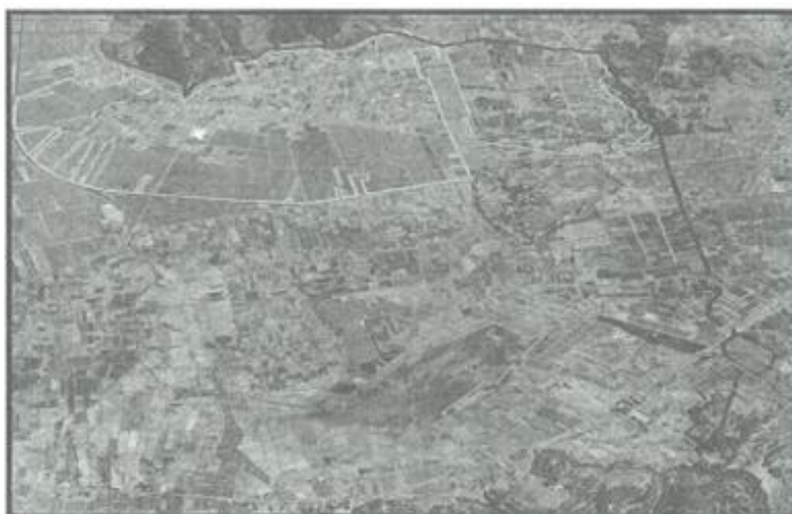
Figura N° 02: Área de estudio del proyecto – Comunidades Campesinas de Yungaqui, Occoruro, Mosocllacta y Markjo

En el presente estudio se considera como área de estudio al espacio territorial que comprende las Comunidades Campesinas de Yungaqui, Occoruro, Mosocllacta y Markjo del distrito de Anta; pues la potencial población beneficiaria, la futura infraestructura de riego (Unidad Productora) y las otras UP existentes a las cuales puede acceder la población afectada, se localizan dentro de este territorio. En la siguiente ilustración podemos apreciar la dimensión territorial del área de estudio: