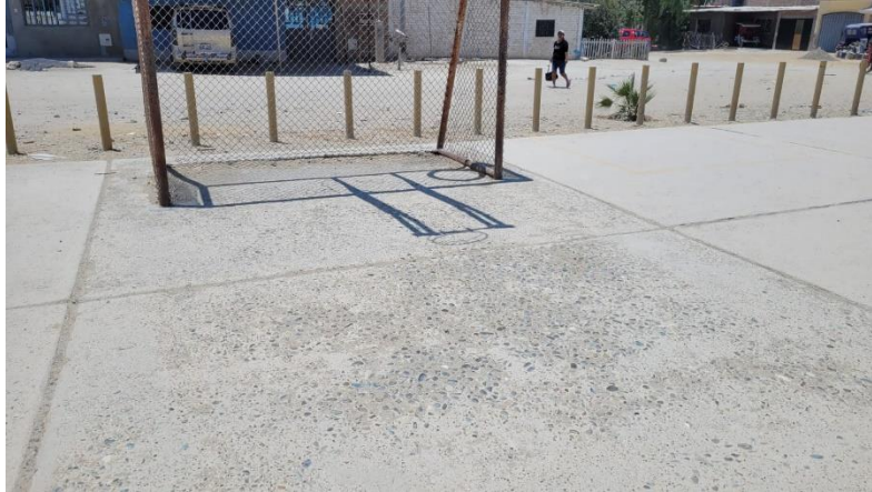
Imagen N°02: Mal estado de la tribuna