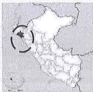
Figura N° 1: Ubicación dentro del Departamento de Lambayeque

Año de la recuperación y consolidación de la economía peruana