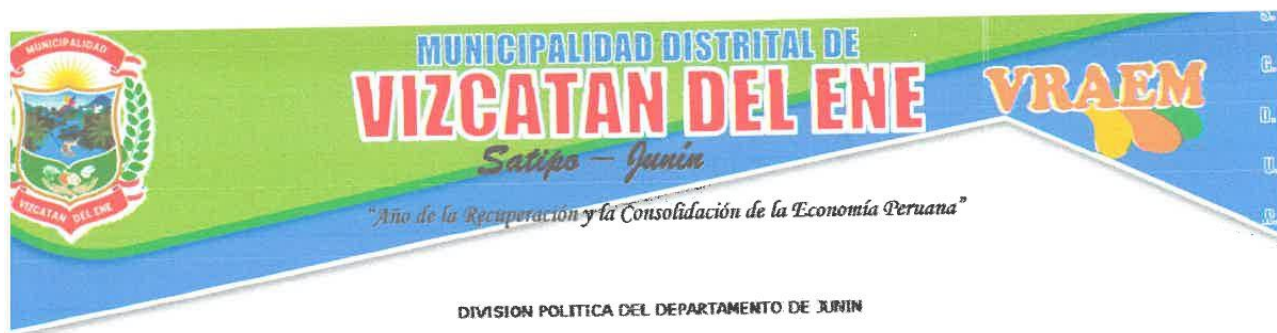
DIVISION POLITICA DEL DEPARTAMENTO DE JUNIN