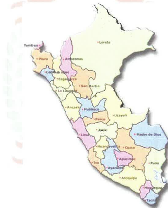
GRAFICO N°02: REGIONAL