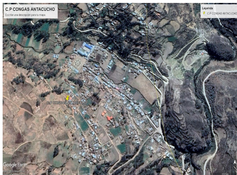
Mapa 4: Satelital del distrito de Huaricolca Zona del proyecto.