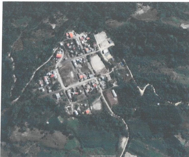
IMAGEN SATELITAL DE LA UBICACIÓN DE LA IEI NUEVA FORTALEZA