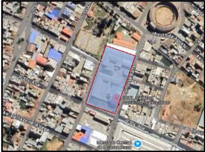
Ilustración 1- Ubicación del terreno

Región : La Libertad Provincia : Sánchez Carrión Distrito : Huamachuco Centro poblado : Huamachuco (Sector 1 Mz. 27 Lote 03) Dirección : Jr. José Balta N° 1005 Huamachuco