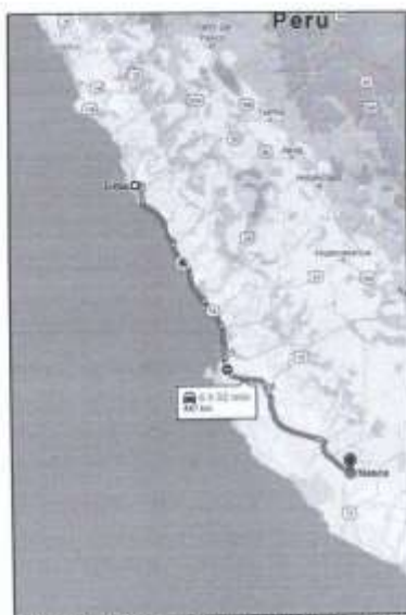
IMAGEN N°05 - RUTA TERRESTRE LIMA - NASCA (443 KM)