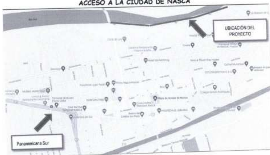
IMAGEN N°1.3 ACCESO A LA CIUDAD DE NASCA