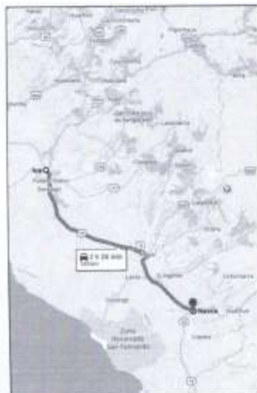
IMAGEN N°06 - RUTA TERRESTRE ICA - NASCA (143 KM)