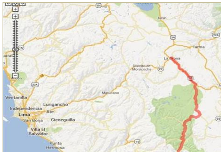
FIGURA N° 04: LA RUTA DESDE LIMA AL DISTRITO DE LA OROYA YAULI (ZONA DE PROYECTO)

El Distrito de la Oroya Yauli es uno de los 10 distritos que conforman la Provincia de Yauli, ubicada en el Departamento de Junín, perteneciente a la Región Junín. El Distrito de La Oroya, es uno de los distritos de la Provincia de Yauli, ubicada en el Departamento de Junín, bajo la administración del Gobierno Local Provincial de Yauli-La Oroya, en el Perú.