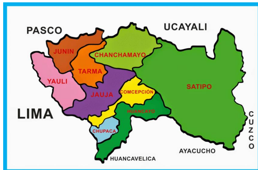
FIGURA 02: PROVINCIA DE YAULI