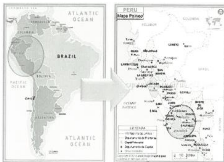
FIGURA N° 01 - MAPA DE UBICACIÓN MACRO