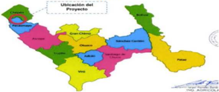
Figura N° 2: Ubicación de la obra en la provincia de Pacasmayo.

Firmado digitalmente por ZUÑIGA PACO MARILIA XIOMARA FIR 73317984 hard Motivo: Doy Visto Bueno Fecha: 12-09-2024 17:29:47 -05:00