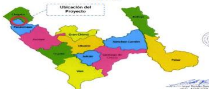
Figura N° 2: Ubicación de la obra en la provincia de Pacasmayo.