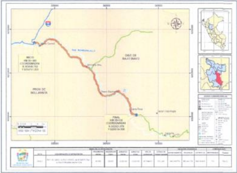
Plano de Ubicación y Localización del Tramo a Intervenir

El servicio se presta en el Distrito de Bajo Blavo, Provincia de Bellavista, Departamento de San Martín. A continuación, se detalla el plano de ubicación respectiva: