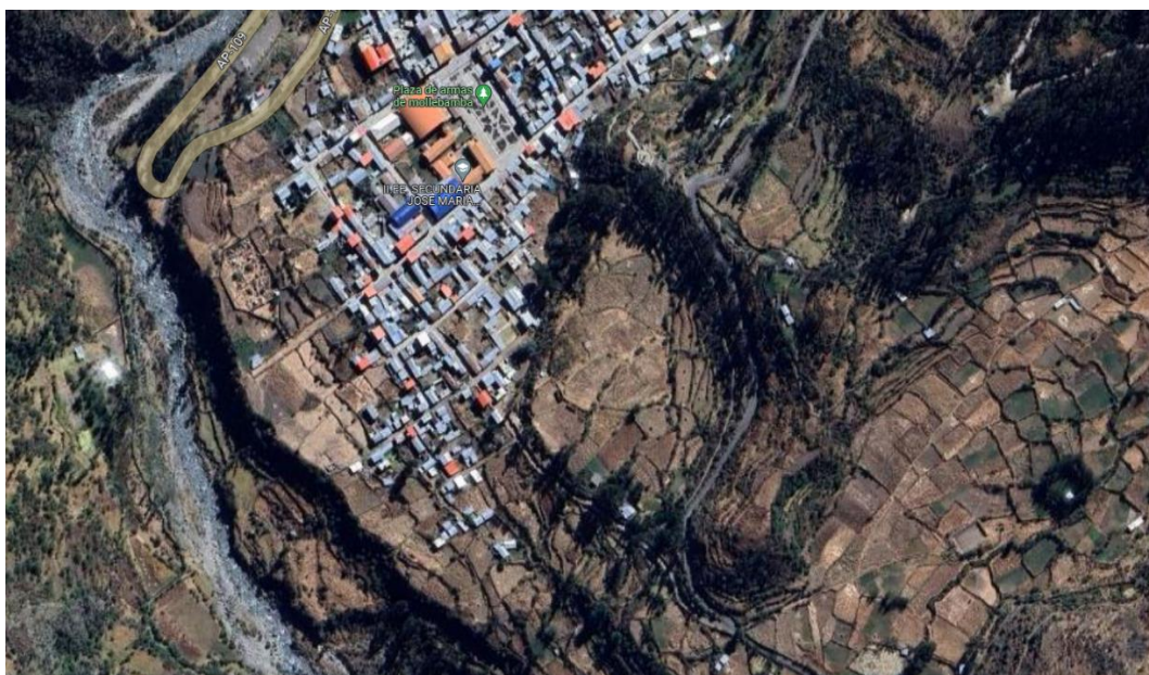
Ilustración 2. Ubicación de la I.E. José María Arguedas