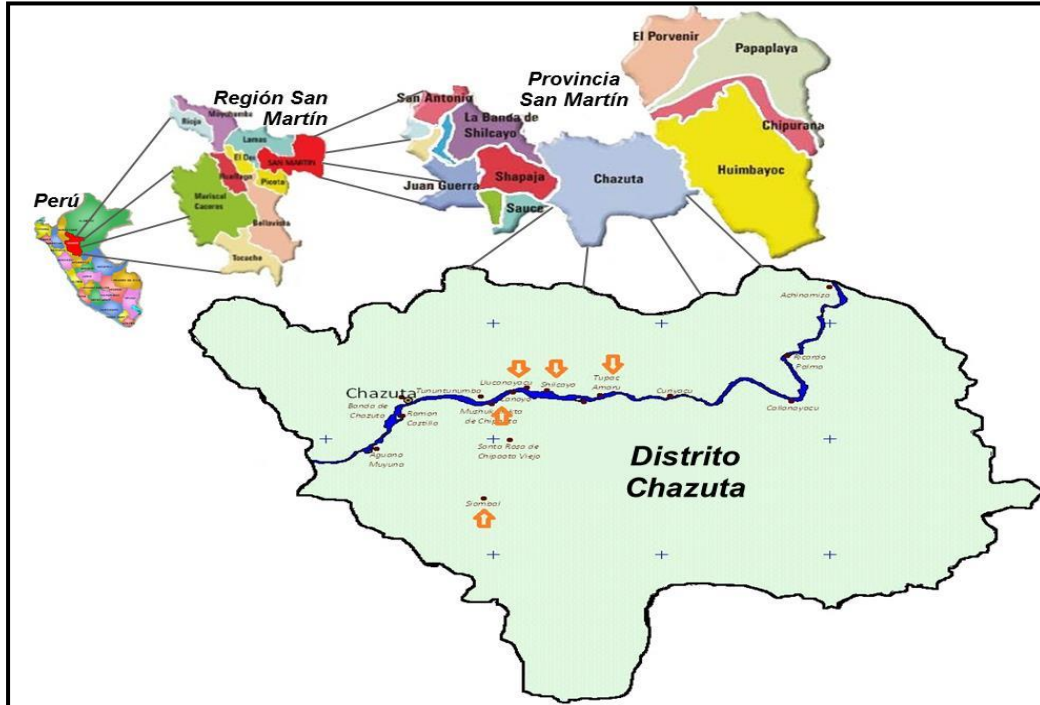
Imagen N° 01 Mapa del distrito de Chazuta

A continuación, se presentan los mapas de macro localización y micro localización del proyecto: