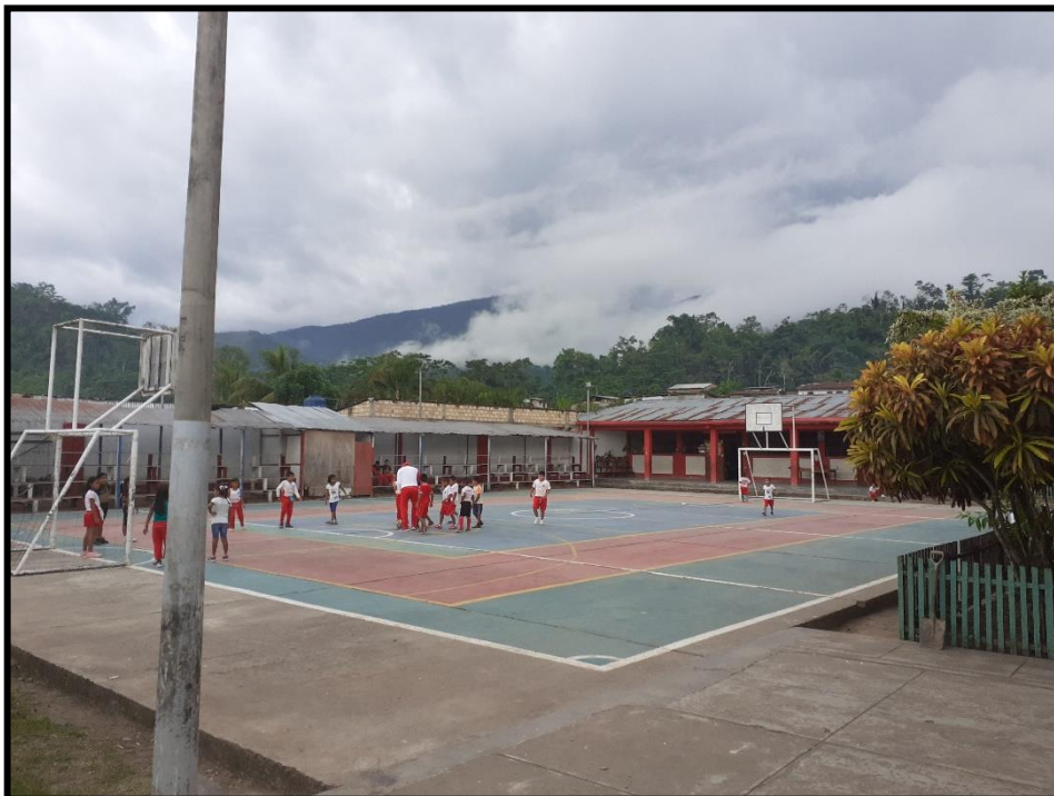
Foto 02. Vista Panorámica de la Losa Deportiva

Los linderos de la edificación existente confinan entre sí el patio y/o losa deportiva, sobre la cual se desarrollan diversas actividades: deportivas, culturales, complementación académica, entre otras; y por ello es un área de recurrente y continua circulación de alumnos, profesores, personal administrativo, padres de familia y visitantes.