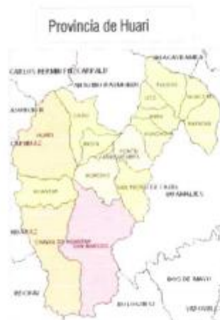
Centro Poblado de Huamantanga

SUB GERENCIA DE OBRAS Y MANTENIMIENTO "Año de la Recuperación y Consolidación de la Economía Peruana"