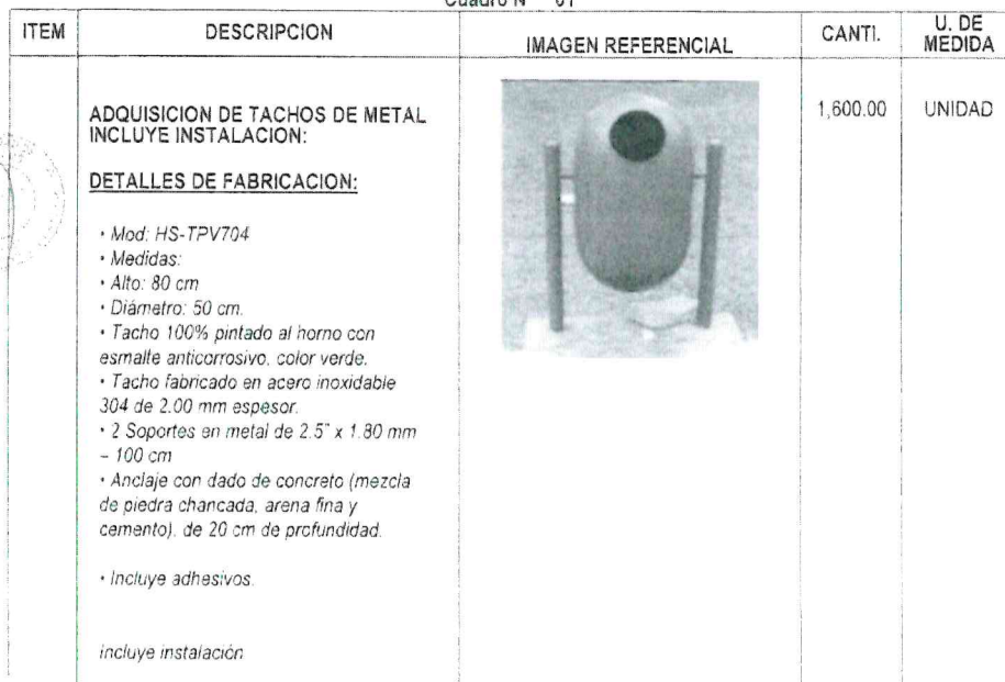
Cuadro N° 01