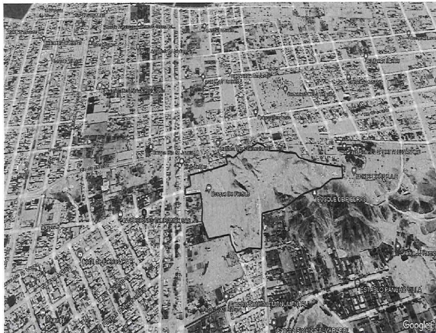
Imagen 1. Ubicación del parque Golda Mier.

El Bosque de Piedra, se encuentra ubicada la zona noreste del Distrito de Parcona, provincia de Ica - Ica, cuyo terreno se encuentra inscrito en los registros a favor de la municipalidad.