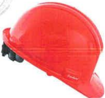
CASO DE SEGURIDAD