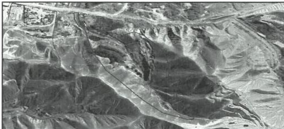
Imagen N° 1: Ubicación del Proyecto de Recuperación de Áreas Degradadas

Mediante RESOLUCION DE GERENCIA MUNICIPAL N°239-2024-GM/A/MPMN de fecha 16/07/2024, APROBAR, el Expediente Técnico del Proyecto de Inversión Pública denominado: "RECUPERACION Y CIERRE DEL ÁREA DEGRADADA POR RESIDUOS SÓLIDOS MUNICIPALES EN EL BOTADERO DE LA QUEBRADA CEMENTERIO PAMPAS DEL CHEN CHEN SUR DEL DISTRITO DE MOQUEGUA - PROVINCIA DE MARISCAL NIETO - DEPARTAMENTO DE MOQUEGUA", Código Único de Inversiones N°2475277, con la actualización de (costos y presupuestos) de conformidad al informe N°1957-2024-SPH/GPP/GM/MPMN, Informe N° 237-2024-JAPV-C-SEI/GIP/GM/MPMN, y el informe N° 167-2024-YLGA-IO-OSLO/GM/MPMN.