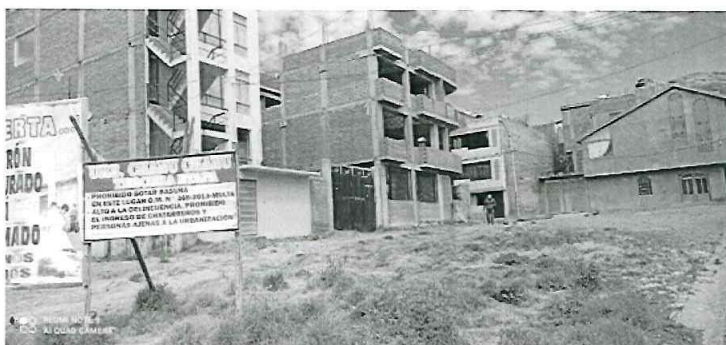
Ilustración 11: Foto tomada desde intersección de Av. Residencial y Calle S/N

Ademas se ha destinado un espacio para el ejercicio al aire libre, incentivando la practica de ejercicio en los jovenes del lugar y propiciando los distintos usos en el espacio de recreacion, dando oportunidad a la integracion de jovenes y pequeños.