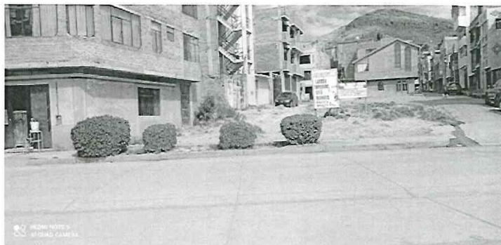
Ilustración 9: Foto tomada desde Av. Residencial

urbanista de la zona y mitigar la contaminación que se produce debido al polvo y suciedad presente en los espacios sin pavimentar y con poco mantenimiento.