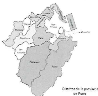
Ilustración 8: Mapa del distrito de Puno