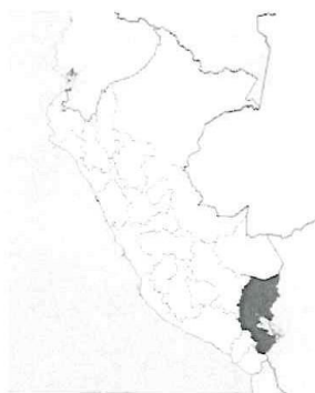
Ilustración 6: Mapa macro de la localización del Perú