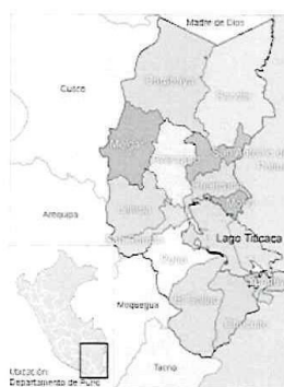
Ilustración 7: Mapa del departamento de Puno