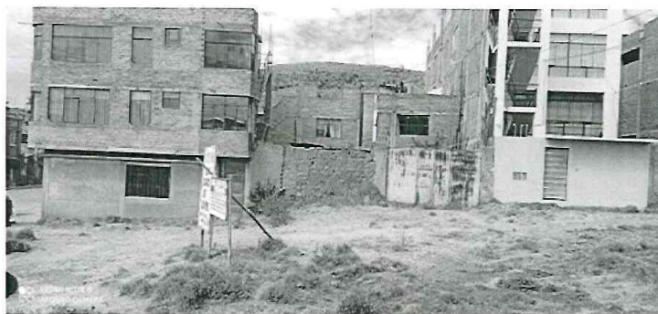
Ilustración 10: Foto tomada desde Calle S/N