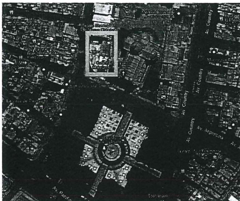
MICRO LOCALIZACION (DISTRITO DE NUEVO CHIMBOTE - PARQUE LA CULTURA)