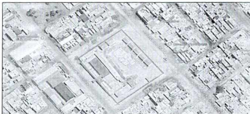
Ubicación del proyecto