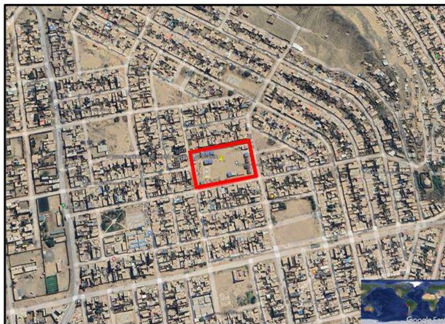
Ilustración 1- Ubicación del terreno

Región : La Libertad Provincia : Trujillo Distrito : El Porvenir (Alto Trujillo) Dirección : Calle España Barrio 3B Mz. 18 Lote 1