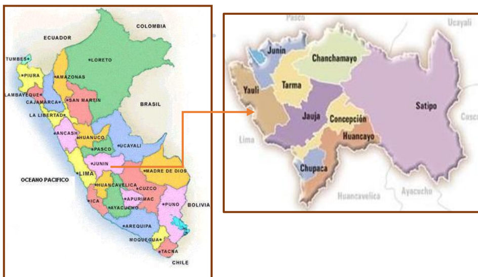
Fig. 1: Ubicación de la región

La ubicación geográfica del proyecto corresponde al anexo - B1 Leoncio Prado del PP.JJ. la Florida Norman King, con coordenadas UTM Este: 399948.205 m, Norte: 8725333.453 m.