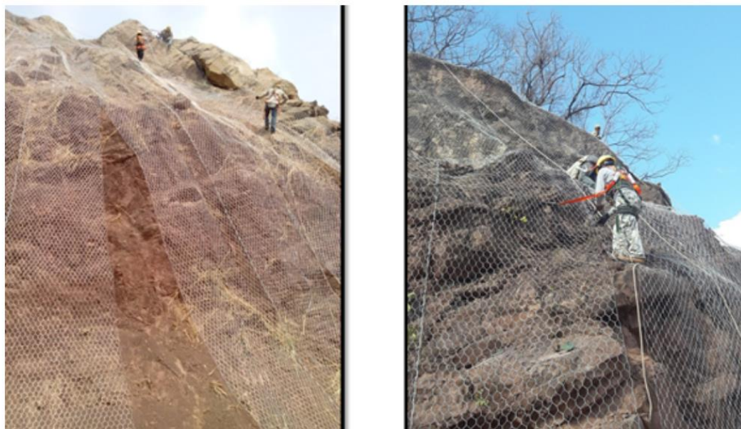
Figura de referencia.