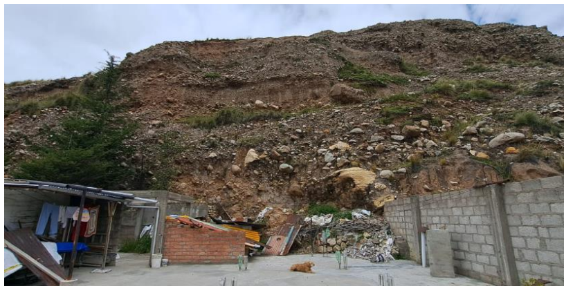
Figura N°01: Condiciones actuales del proyecto

De manera preliminar a los trabajos del presente estudio, se hizo un recorrido de estas zonas en la cual se pudo evidenciar que la caracterización geológica geotécnica del sector corresponde a bancos de areniscas cuarzosas y cuarcíticas, semimetamorfizados, masivos, muy duros, competentes, pertenecientes a la Formación Chimú en su miembro superior (Ki-chim s), con poca cobertura de Depósitos coluviales (Q-co) o de colapso (Q-cp). Condiciones geológicas y geotécnicas poco difícil para la excavación de la plataforma y taludes de corte. De acuerdo a lo anterior, las Clasificación de Materiales corresponde a Roca Fija en 60%, Roca Suelta en 20% y Suelos en 20%. Por consiguiente, los trabajos de construcción de los accesos han quedado conformados con un talud de (H: V) 1:3. En un tramo de 131.91 m de longitud y lo solicitados para los trabajos de estabilización de taludes con malla metálica corresponden a lo señalado en la ficha técnica y el presente expediente técnico.