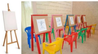
Imagen referencial de lo solicitado por PROMPERÚ