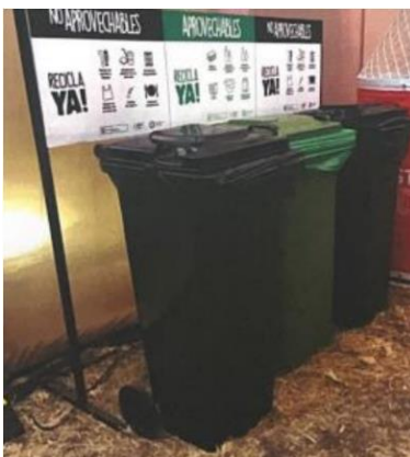
Imagen referencial de lo solicitado por PROMPERÚ