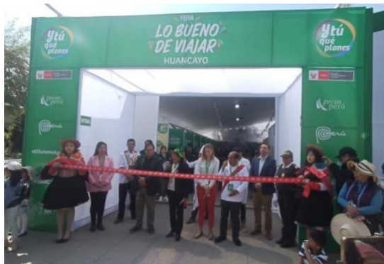
Imagen referencial de lo solicitado por PROMPERÚ