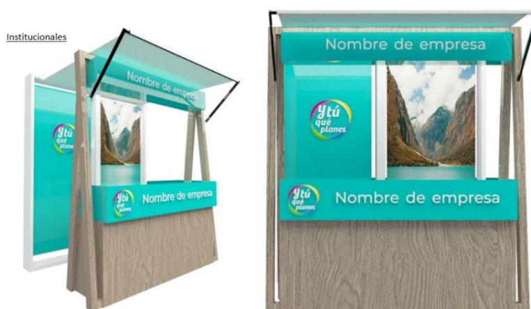
Imagen referencial de lo solicitado por PROMPERÚ