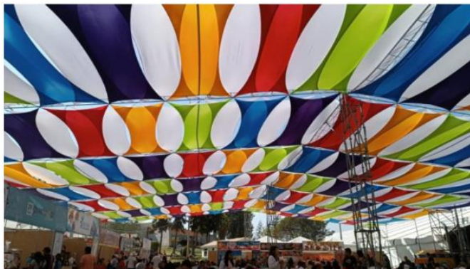
Imagen referencial de lo solicitado por PROMPERÚ