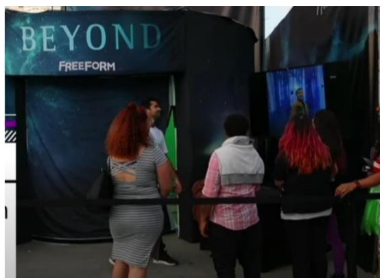
Imagen referencial de lo requerido por PROMPERÚ