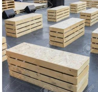
Imagen referencial de lo solicitado por PROMPERÚ