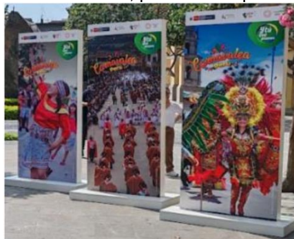
Imagen referencial de lo solicitado por PROMPERÚ