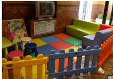
Imagen referencial de lo solicitado por PROMPERÚ