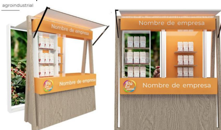
Imagen referencial de los módulos de productos y gastronomía solicitado por PROMPERÚ