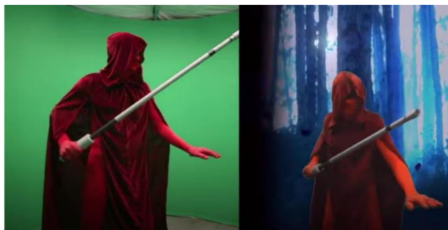
Imagen referencial de lo requerido por PROMPERÚ