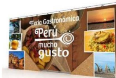
Imagen referencial de lo solicitado por PROMPERÚ