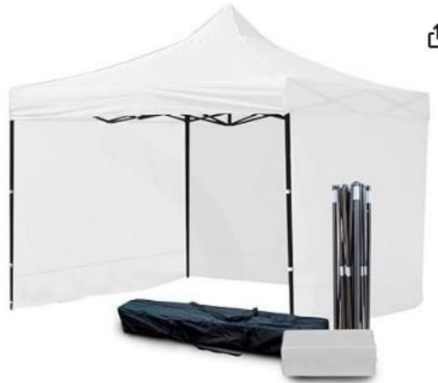
Imagen referencial de lo solicitado por PROMPERÚ