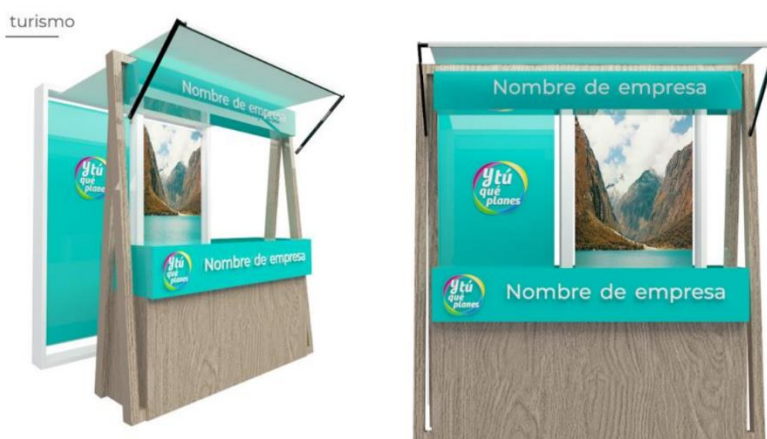
Imagen referencial de lo solicitado por PROMPERÚ