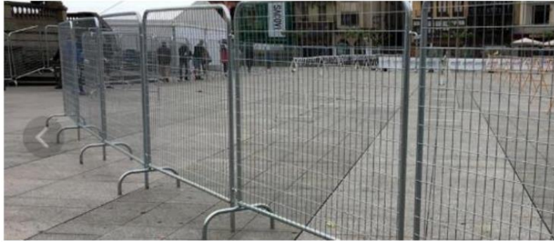
Imagen referencial de lo solicitado por PROMPERÚ