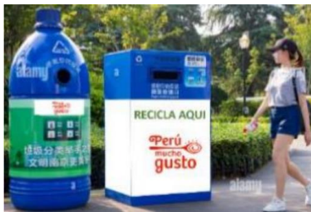
Imagen referencial de lo solicitado por PROMPERÚ