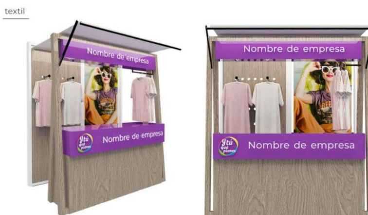
Imagen referencial de lo solicitado por PROMPERÚ