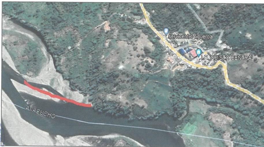
FIGURA: 02. VISTA SATELITAL DEL RIO APURÍMAC SECTOR MANGOSTINO – QUISTO CENTRAL