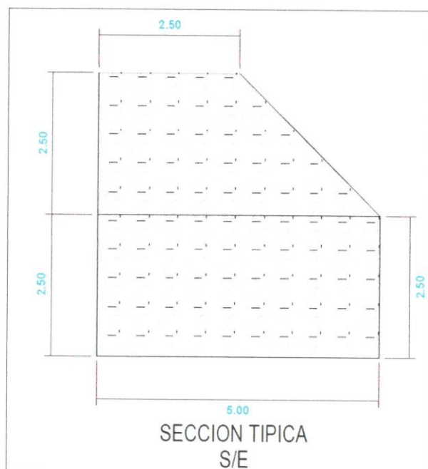
METRADO MOVIMIENTO DE TIERRA