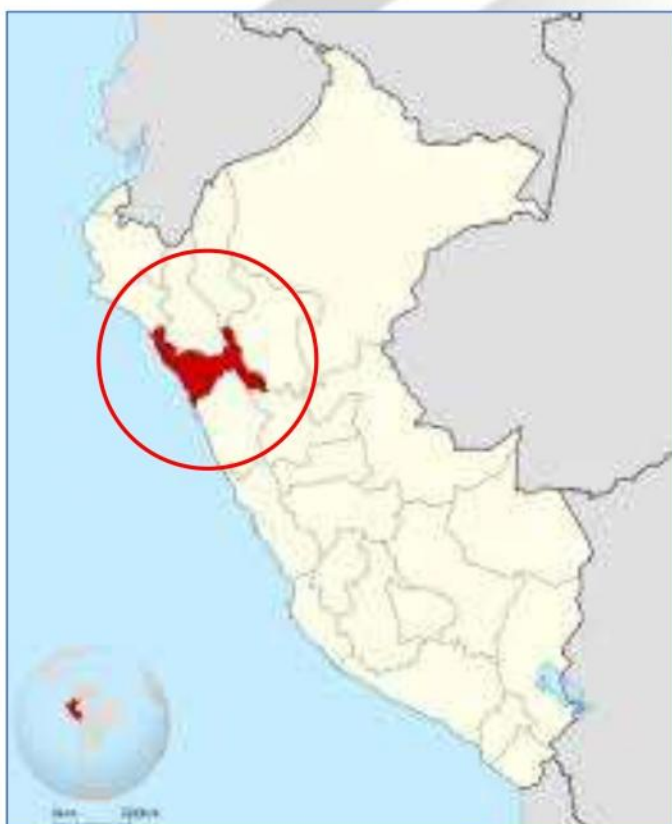
DEPARTAMENTO : LA LIBERTAD