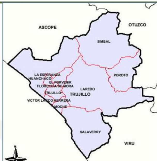
MAPA PROVINCIAL TRUJILLO