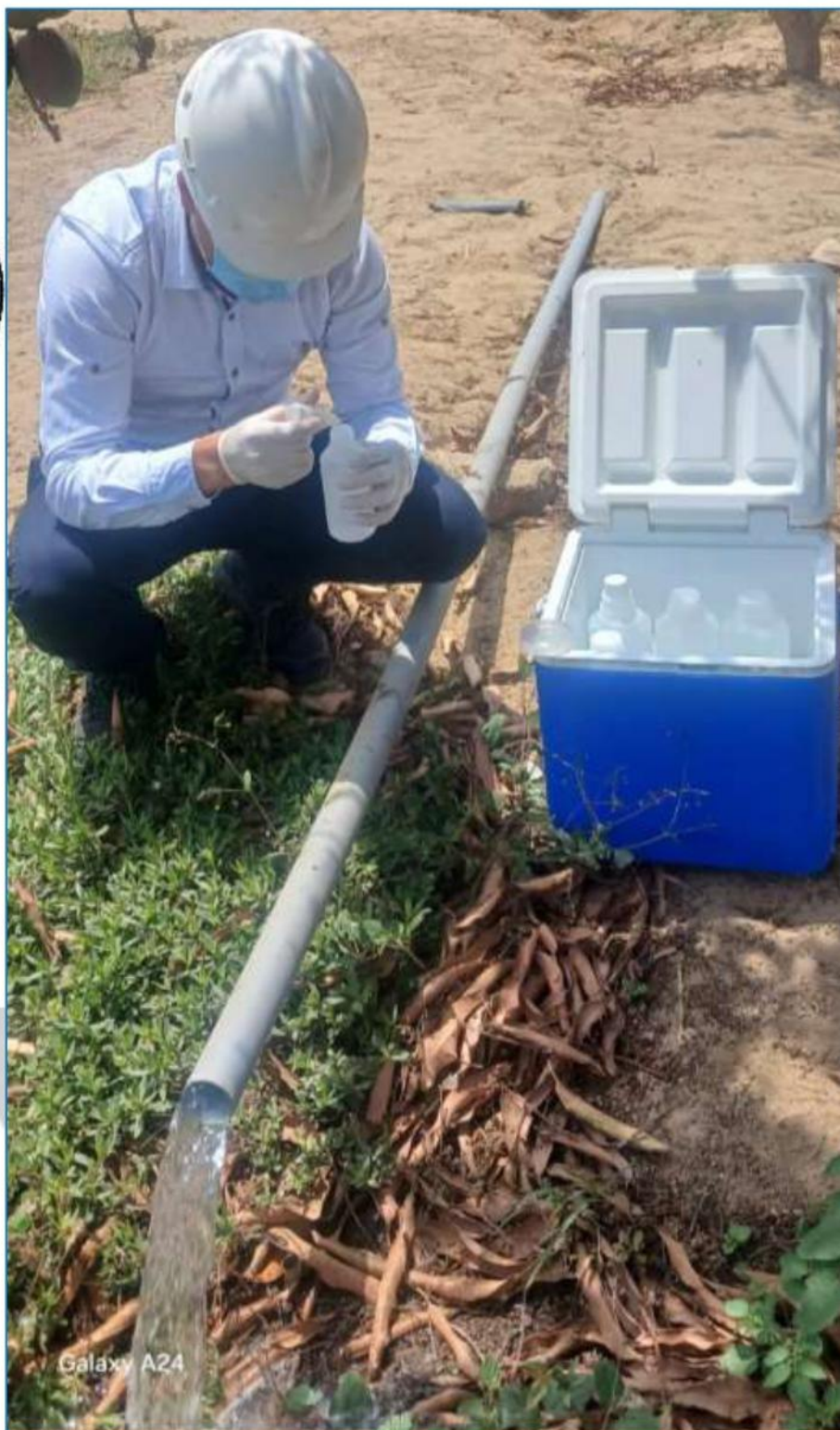
Fotografía 10 : Muestreo De Agua Para Ensayos.