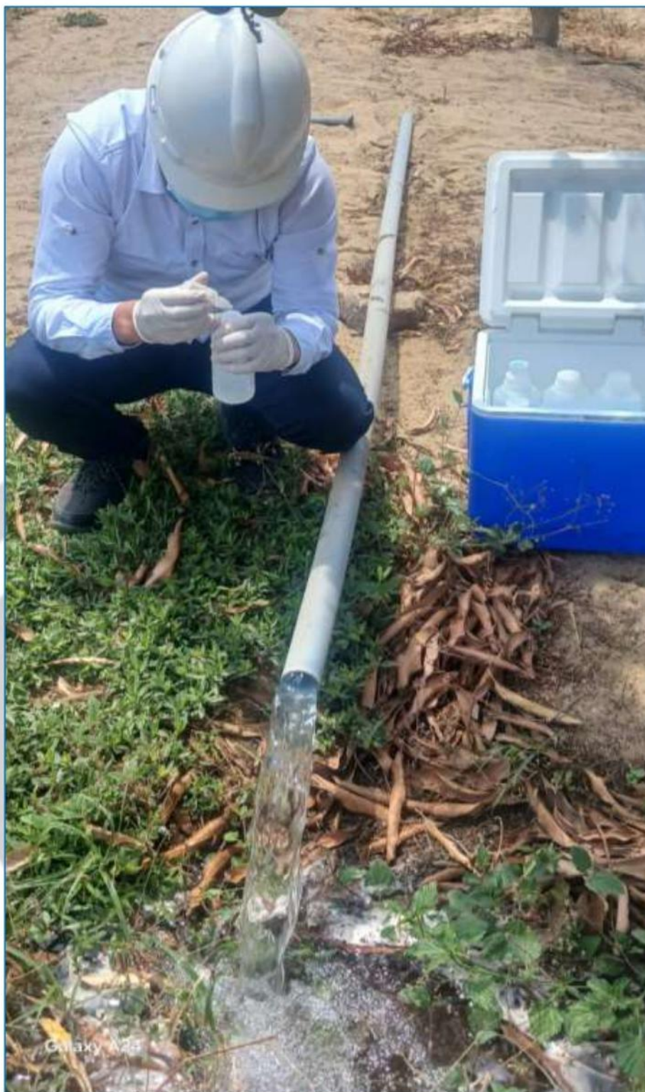
Fotografía 09 : Muestreo De Agua Para Ensayos.