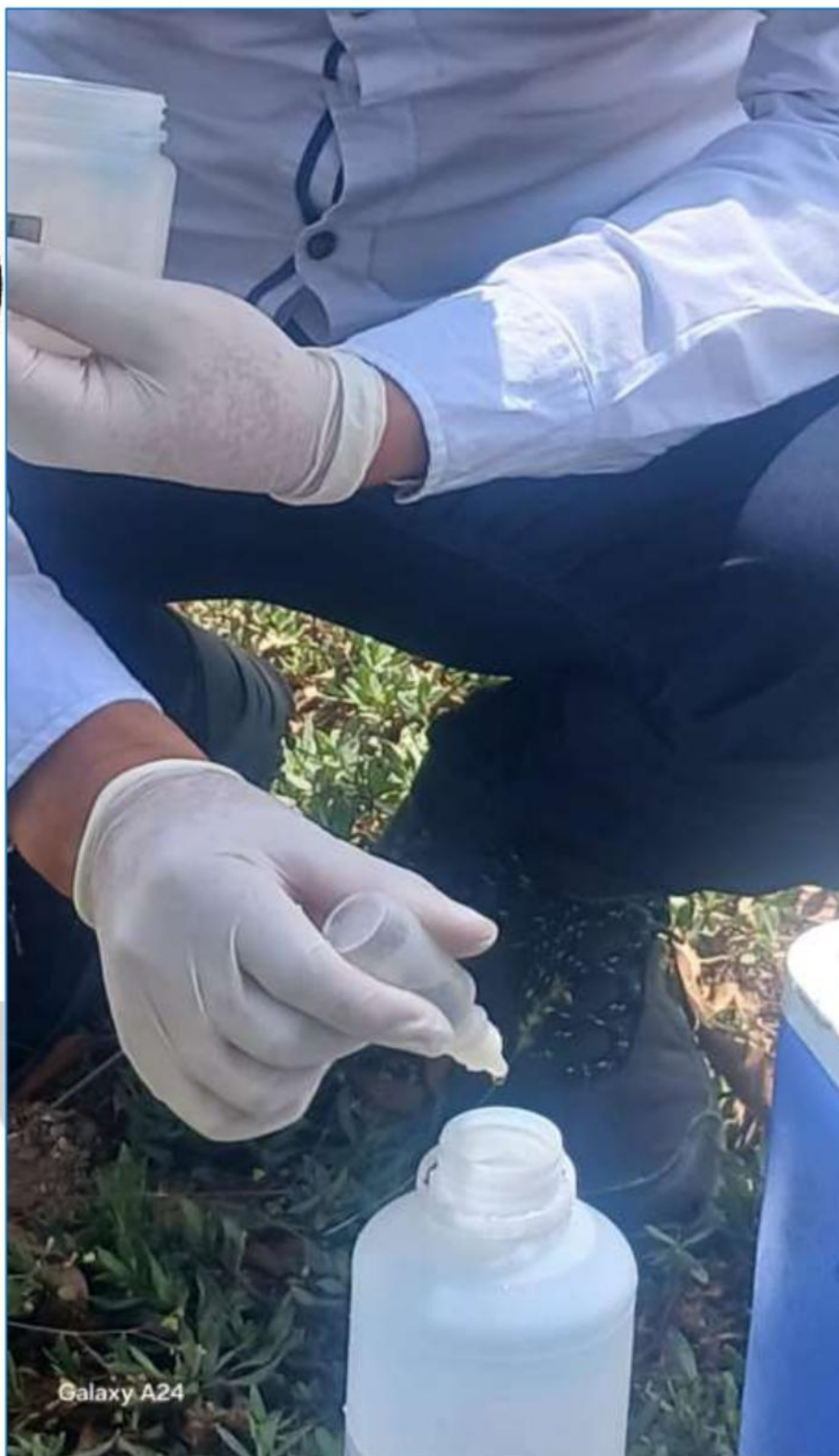
Fotografía 08 : Muestreo De Agua Para Ensayos.

Página Web : www.ingeofaltop.com.pe Correos de contacto : gerencia@ingeofaltop.com.pe administrador@ingeofaltop.com.pe cordinador@ingeofaltop.com.pe Teléfonos de contacto : 963806949 / 948404284 / 956243475 RUC : 20602382312