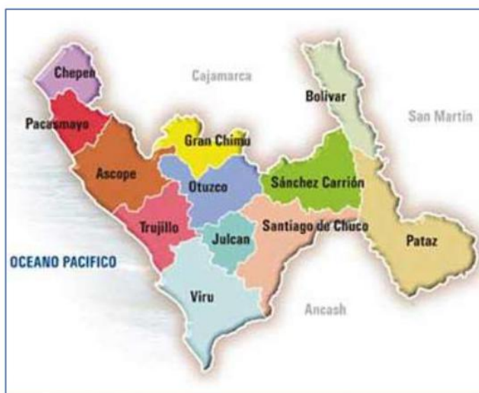
PROVINCIA : ASCOPE

ESPECIALISTA EN ELABORACION DE EXPEDIENTES TECNICOS Y PROYECTOS EN GENERAL INGENIERIA, LABORATORIO, TOPOGRAFIA, ARQUITECTURA Y CONSTRUCCION